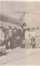
Delegacion di Aruba cu instalacion di e grupo di reunion di e grupo (Janu...